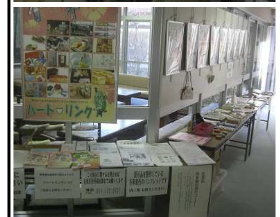
思わず手に取って、笑顔になってしまうような作品が並びました。