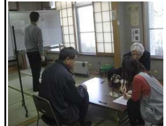
講座の 抽選会場 今年は3講座が抽選となりました