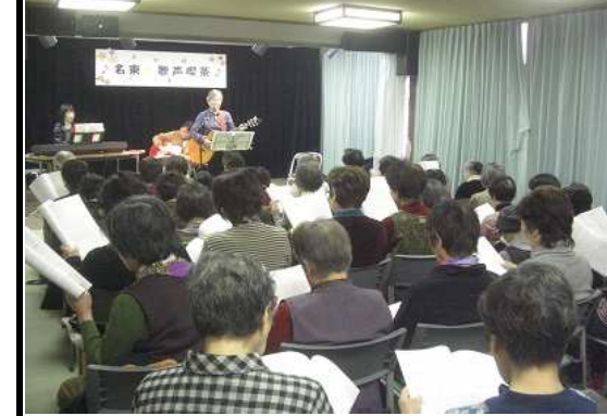
歌集を見ながら、懐かしい歌を一緒に歌いました♪