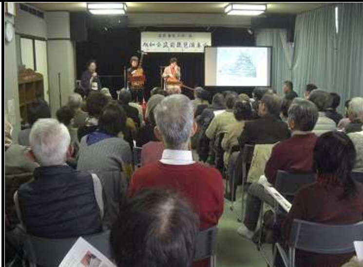
雅な調べはいかがでしたか？

恒例となりつつある演奏会、次回も元気で張りのある声を是非聞かせていただきたいと思っています。