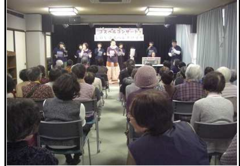
揃った歌声で会場は癒しに包まれました♪

名東福祉会館では初めての開催となったゴスペルコンサート。「LOVクワイヤ」の皆様の美しい歌声は、会場にお越し頂いた方々を魅了してくれました。 オリジナルのゴスペルソングから、お馴染みの懐かしい曲まで、その歌に合わせて体を揺らしながら聞いている人まで見かけられ、皆さんがその世界を堪能している様子が伺えました。 最年少の出演者である小学校六年生の男の子が歌ったその声には、会場の皆さんもビックリ！「孫を見ているようでドキドキしたけれど、上手だったわねえ」そう語った方の優しい眼差しが印象的でした。