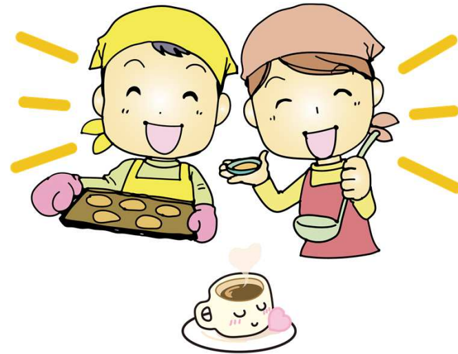
楽しみにしていた方も多く、当日は大盛況♪ 子供達も大忙しでした☆

ご参加いただいた皆さん、そして何よりも美味しいおもてなしをしてくれた児童館の皆さん、素敵な時間をありがとうございました。