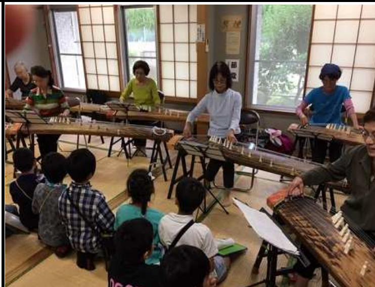
小学生による福祉会館訪問の光景 優しくお相手をして頂きました☆

毎月第1～第4金曜日の午前中、囲碁室か ら癒しの音色が漏れてきます。 琴同好会「ちどり会」の皆さんは、地域のデ イサービスなどにもボランティア(慰問演奏) に行っていただく機会も多く、たくさんの皆さ んに喜ばれています。 先日は、名東小学校の訪問を受けて演奏 と楽器の説明などご協力をいただき、生徒さ ん達も興味津々の様子でした。 毎年恒例・お楽しみ演芸会でも、午後の一 番手で会場にその素敵な曲を届けていただ けます。 演奏でも、積極的にボランティアに協力して 頂けるその皆さんの人柄でも、本当に魅力 に溢れる同好会です。