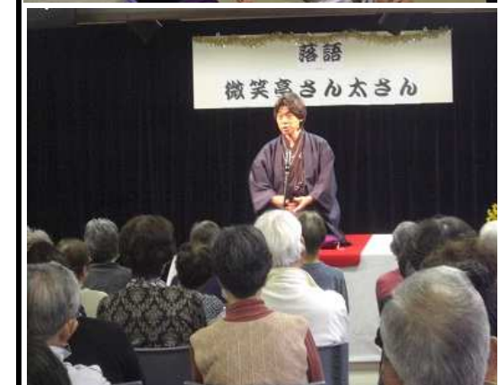
さん太さん の好演に、 会場は爆 笑に包まれ ていました。