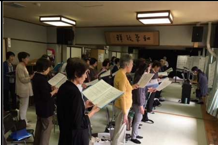
大所帯の撮影。 「今度は自分達の近くで撮ってね」 数名の方に言われてしまいました(^.^)