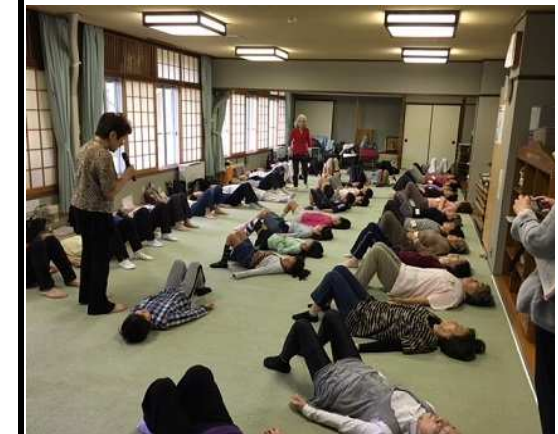
小学生も一 緒にヨガの 体験☆